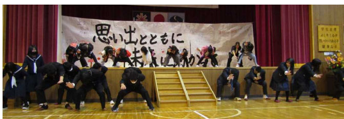
涌元ソーラン アンコールは中・高生と一緒に(思い出を語る会)