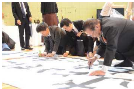
涌元小への思いを寄せ書き