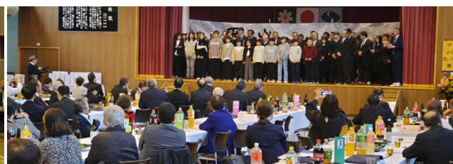
卒業生がステージに上がって校歌斉唱(思い出を語る会)