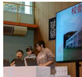
児童の発表(思い出を語る会)