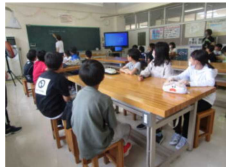
涌元小での5年生合同学習

6月から7月にかけて多くの合同学習を実施しています。6年生は修学旅行、5年生は宿泊学習、4年生は社会科見学に関わる学習です。そのほかにも、外国語や理科の合同学習、給食を一緒に食べたり、涌元小学校に来てもらったりという交流も行っています。また、水泳学習も合同で実施する予定です。