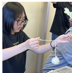
吊りこま絵付け体験