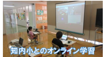
知内小とのオンライン学習

北海道の夏は、昔から気温も湿度も低く過ごしやすと言われてきました。しかし、近年、北海道の夏も本州並みに暑くなってきました。北海道のエアコン普及率を調べると、25.9%（2014年）から42%（2021年）にもなっています。「北海道にエアコンは必要ない。うちわや扇風機で十分。」なんて、もう昔の話なのかもしれません。今年の夏も暑さが激しくなりそうです。熱中症には十分にお気をつけください。