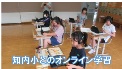
知内小とのオンライン学習

最後になりましたが、1学期は保護者や地域の皆様には、涌元小学校の教育推進に対して、たくさんの温かいご支援をいただいたことに深く感謝申し上げます。8月24日（木）の2学期始業式の日、「おはようございます！」と元気に登校して来る14名の児童を、教職員一同温かく出迎えたいと思っています。事故やけがのない楽しい夏休みをお過ごしください。