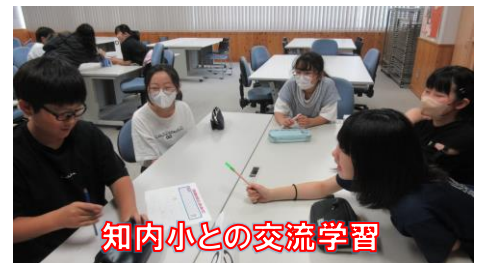
知内小との交流学习

毎日学校に通い規則正しい生活から、自分で自分の生活を管理して毎日過ごす生活へととなります。保護者の皆様には、お子様が事前に立てた夏休みの計画がしっかりと実行できるように、「ほめて、認めて、励まして、困っていたらアドバイス」をしてくださいますようお願いいたします。